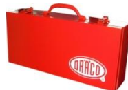
Transportkoffer Metall 18000

die leichten, kompakten und robusten Scheren sind sowohl in der Montage als auch in der Massenproduktion mittels Linearführungssystem einsetzbar