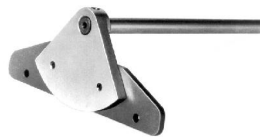
Streifenschneider S/01 Anschlag zum Schneiden paralleler Streifen bis 100, 250 und 500 mm

(Für UA-Profile (2 mm) Typ 3515 verwenden)